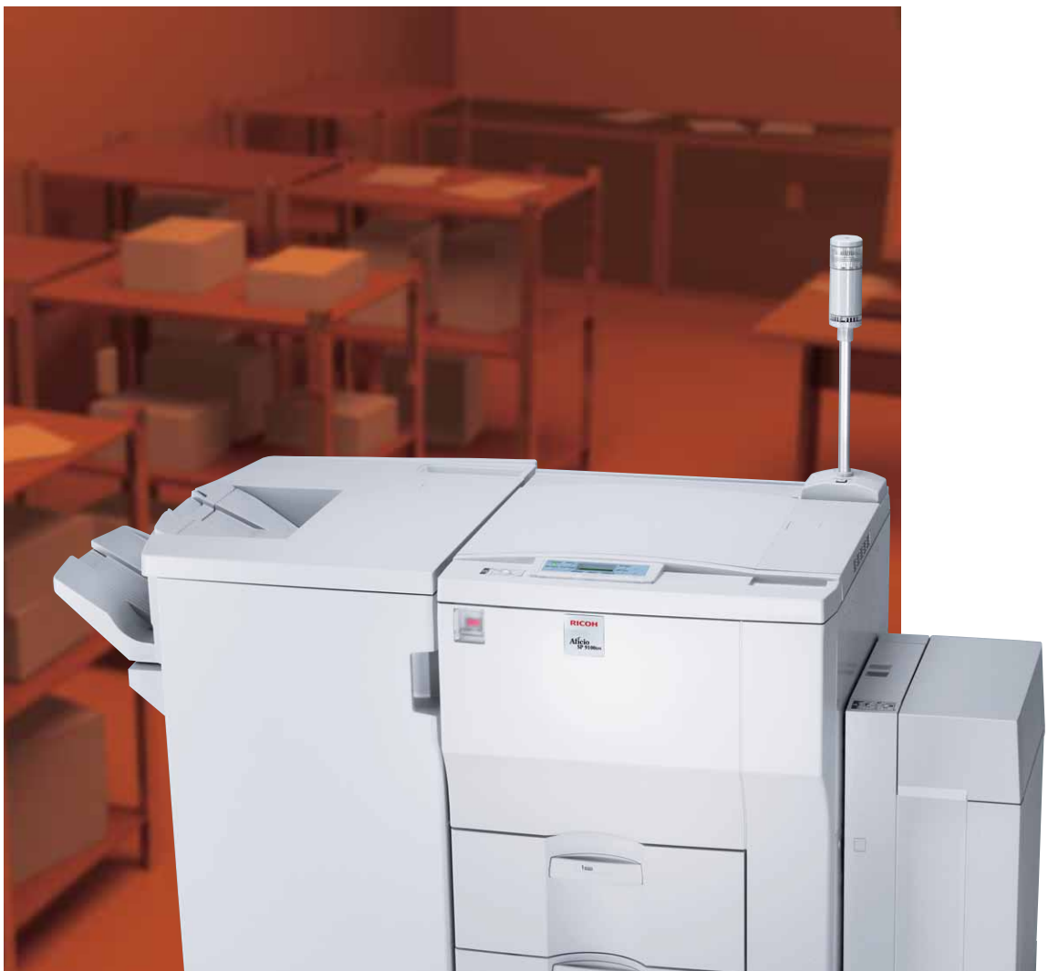
Aficio™ SP 9100DN